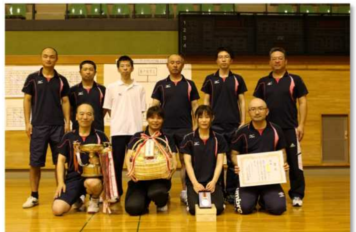
優勝した瀬戸内市Aチームの皆さん

9月3日、赤磐市山陽ふれあい公園総合体育館において開催し、参加13チームによる熱戦の末、瀬戸内市Aチームが2年連続で優勝しました。準優勝は浅口市チームでした。