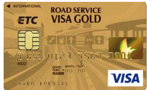
ロードサービスVISAゴールドカード