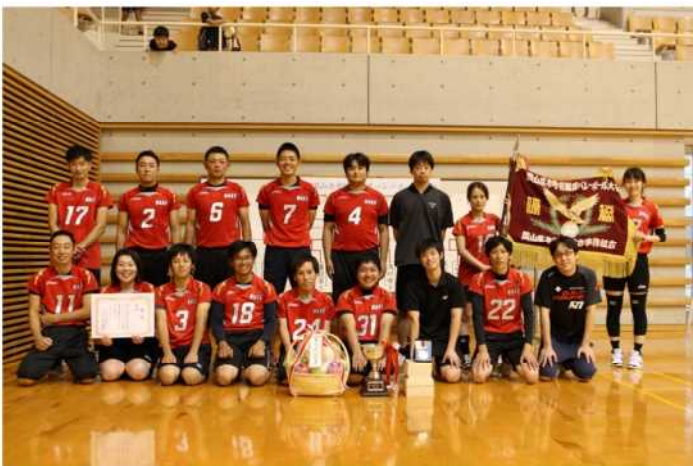
優勝した和気町チームの皆さん

10月1日、岡山県総合グラウンドジップアリーナ岡山において開催し、各地区代表の14チームによる熱戦の末、和気町チームが2年連続で優勝しました。準優勝は赤磐市チームでした。